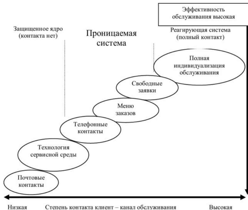
Рис. Сервис – системная матрица

Основой выбора формы организации сервиса является сервис - системная матрица, в которой по оси абсцисс отложена степень контакта в канале обслуживания, а по оси ординат - форма организации сервиса (рис. Сервис – системная матрица).