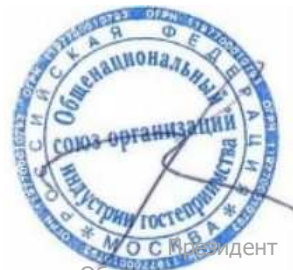
Президент Общероссийского союза индустрии гостеприимства А.В. Волков